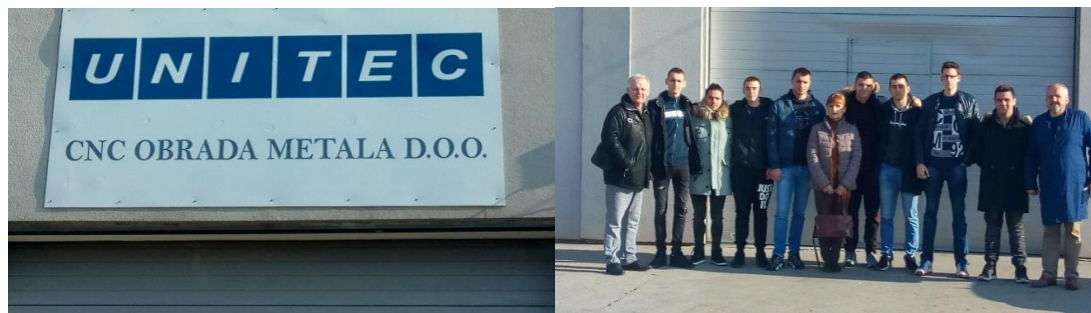
Посета компаније Unitec