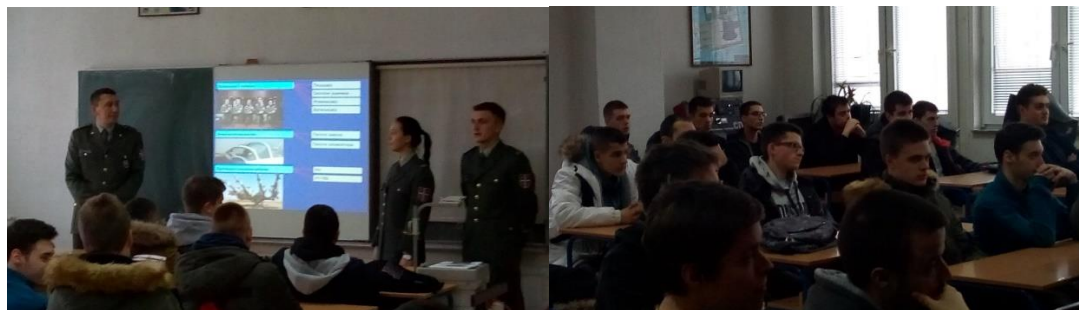
Презентација Војне академије у нашој школи